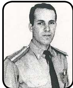
این فرد نیکوکار جامعه را شناسایی نمایید. جواب در بخش انگلیسی Who is this important person? (See English Section)

تکنیسینی که بر روی این آب نوردهای بی سرنشین کار می کند به اهمیت آنها ها در کار پلیس اشاره می کند و از جمله بر نقش آنان در امر مبارزه با قاچاقچیان مواد مخدر و جلوگیری از ماهیگیری غیر مجاز تاکید دارد و می گوید به این ترتیب می توان از دور با دوربین و رادار مراقب حرکت همه کشتی ها بود. ماهواره های یو جانیبه ارتباطی نصب شده در آب نوردهای متکوری می تواند اطلاعات را به مرکز کنترل ساحلی برساند و دستورات لازم را دریافت کند.